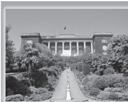
Американски протестантски Робърт колидж в Истанбул.

През този период протестантските мисионери застават на страната на Фердинанд и националната кауза. Макар кореспондент на Ню Йорк Хералд да съобщава на Лок как Стамболов му е казал в интервю, че „много ще се радва да освободи България от нас, от нашето училище и