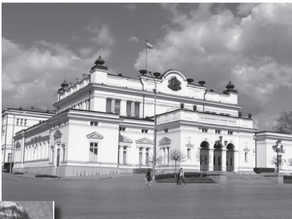
Лок пише: „Надникнах в Народното събрание, където може да се види как селянинът с носия и градският жител седят един до друг, всички явно заинтересовани от създаването на закони за своята страна. Цялата дейност изглежда организирана и извършвана така методично, както у нас.“

Ролята на протестантите за изграждане на националното ни самосъзнание, нравственост и освобождение.