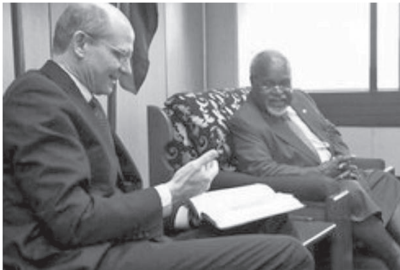
Председателят на световната Адвентна църква Тед Уилсън изучава Библията с министър председателя на Папуа Нова Гвинея - Майкъл Сомар. Уилсън се срещна с националния лидер миналата седмица по време на своята 16-дневна обиколка из Южния Пасифик.

Адвентистите "трябва да бъдат уникални" чрез влиянието, което имат, на мястото, в което живеят, казваше Тед Уилсън