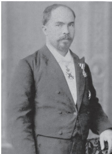
Стефан Стамболов Той е „един от неколцината най-велики европейски държавници от втората половина на XIX в.“ (Мотгое)

Следващото десетилетие и годините до края на века са период на затвърждаване на българската свобода. Седемте години - от 1887 до 1894 г. - обхващат дълготното управление (т.н. „режим на Стамболов“) на Стефан Стамболов като министър-председател.